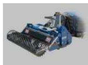
Tabela rozmiarów i zastosowania w maszynach CSF Multione: