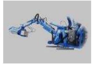
Tabela rozmiarów i zastosowania w maszynach CSF Multione: