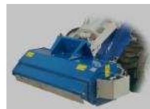
Tabela rozmiarów i zastosowania w maszynach CSF Multione:

do modeli: M 3WD , M 4WD , S , SL , SL 800 , GT