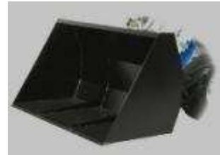
Tabela rozmiarów i zastosowania w maszynach CSF Multione: