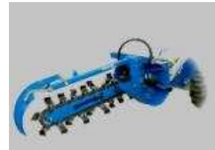
Tabela rozmiarów i zastosowania w maszynach CSF Multione: