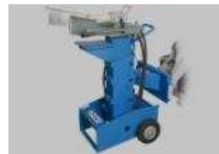
Tabela rozmiarów i zastosowania w maszynach CSF Multione:

do modeli: M 3WD , M 4WD , S , SL , SL 800 , GT