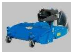
Tabela rozmiarów i zastosowania w maszynach CSF Multione: