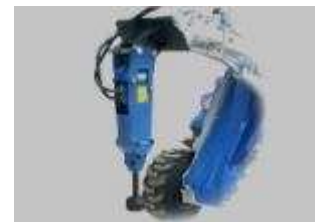
Tabela rozmiarów i zastosowania w maszynach CSF Multione: