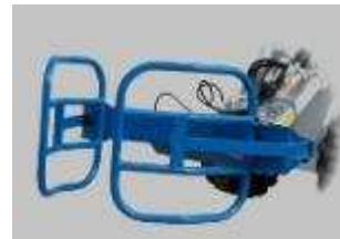
Tabela rozmiarów i zastosowania w maszynach CSF Multione: