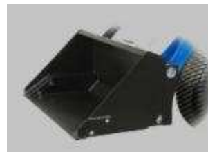
Tabela rozmiarów i zastosowania w maszynach CSF Multione: