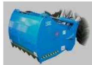
Tabela rozmiarów i zastosowania w maszynach CSF Multione: