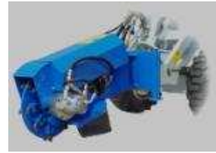
Tabela rozmiarów i zastosowania w maszynach CSF Multione: