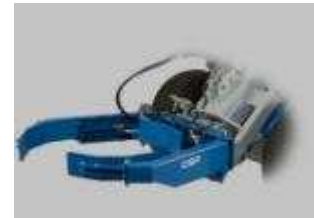
Tabela rozmiarów i zastosowania w maszynach CSF Multione:

do modeli: M 3WD , M 4WD , S , SL , SL 800 , GT