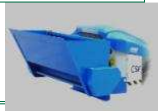
Tabela rozmiarów i zastosowania w maszynach CSF Multione: