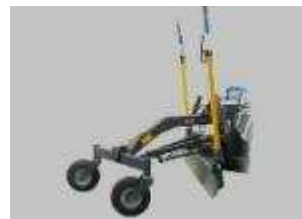
Tabela rozmiarów i zastosowania w maszynach CSF Multione: